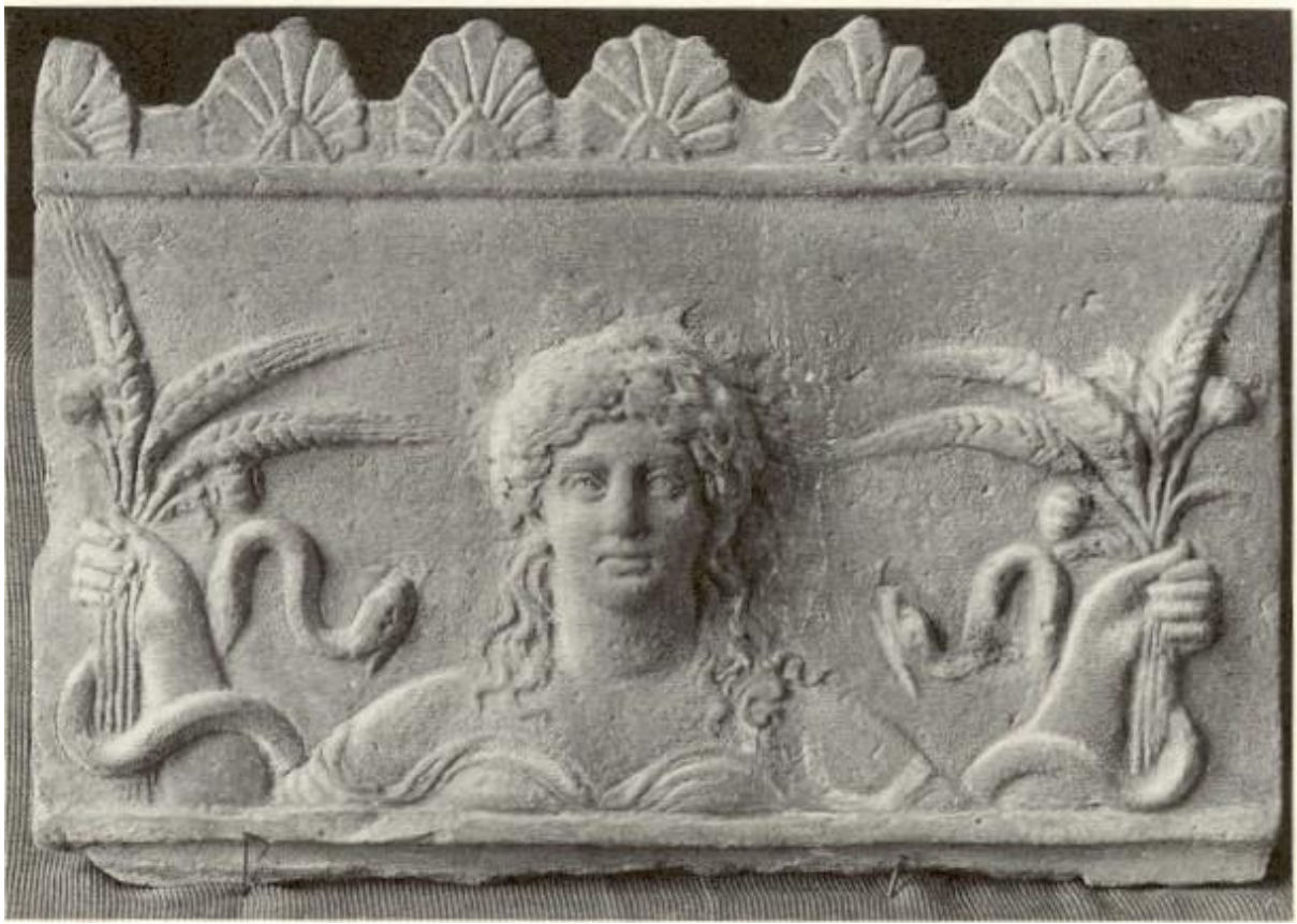
Ceres - kopia