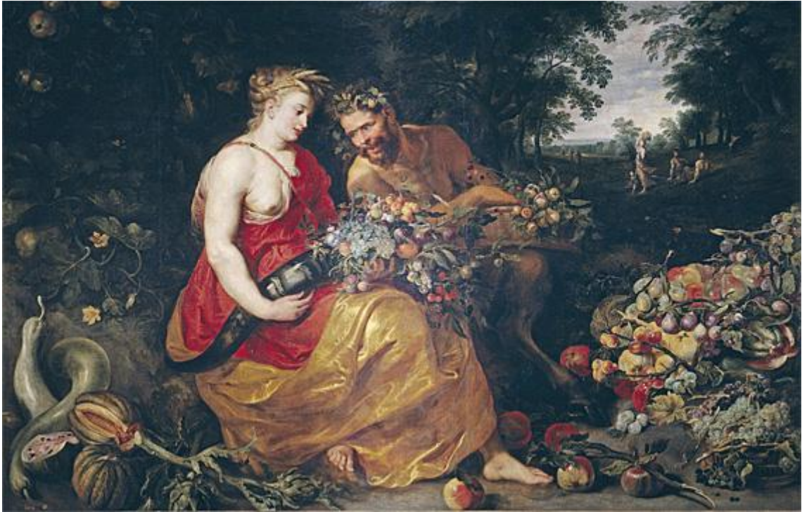
Ceres och Pan av Rubens och Snyder